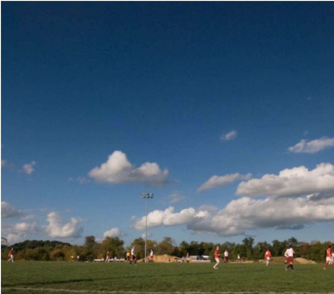
لقطة بعيدة جدا