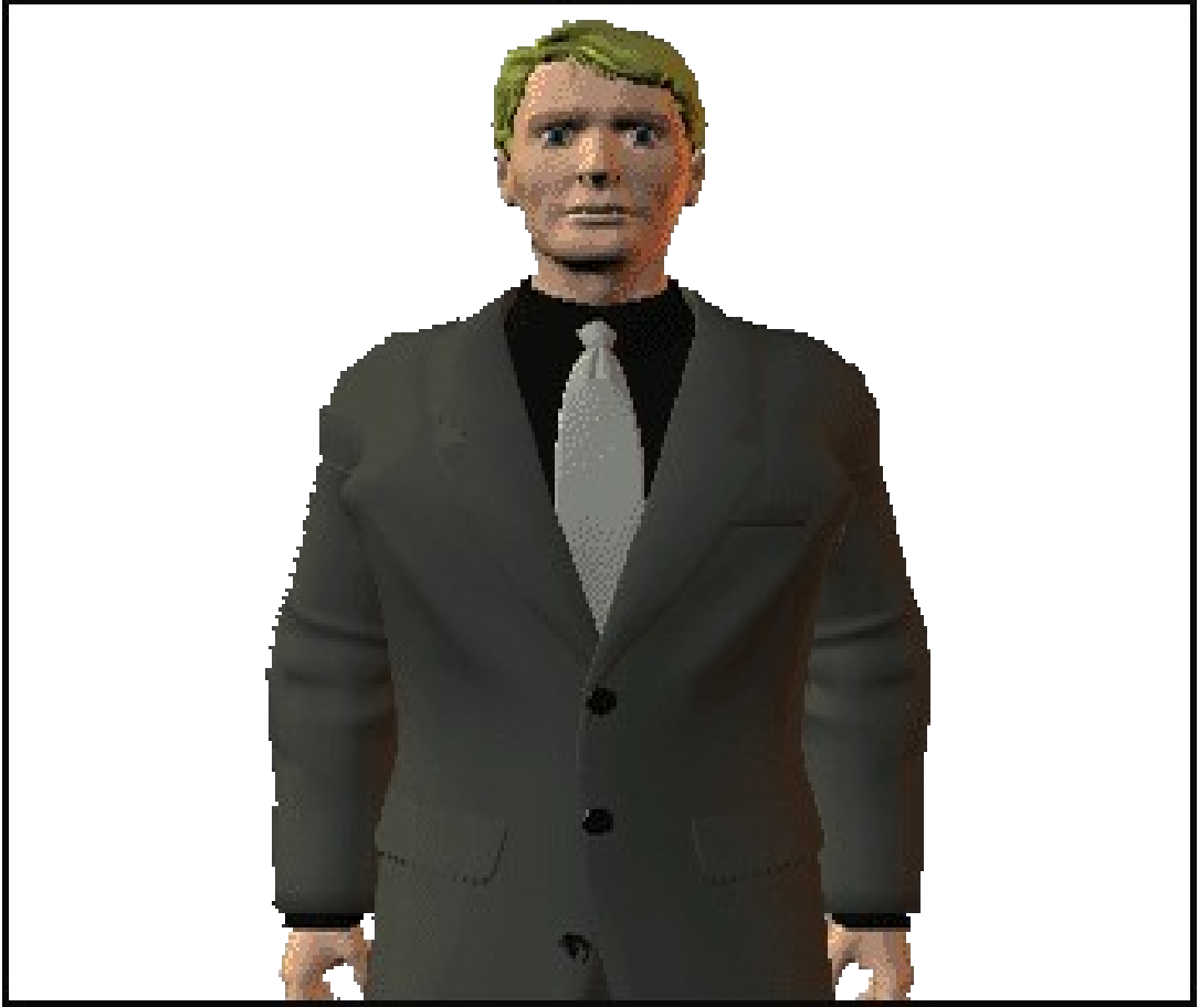
اللقطة المتوسطة medium shot

كما يوجد هناك تنوعات للقطعة المتوسطة مثلا: