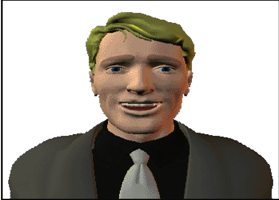
اللقطة المتوسطة القريبة

هي اللقطة التي تصور شخصا من صدره حتى أعلي رأسه . أى أن الحد السفلي للكادر يقطع أسفل مفصل الذراع (أسفل الإبط) أو أسفل جيب الصدر بالنسبة لذكر يرتدي سترة أو بروز الصدر بالنسبة لأنتى. وتظهر تعبيرات الوجه هنا طاغية وعينا الشخص بارزتان. كما أن درجة لون بشرته يمكن تمييزها، وكذلك شكل الندوب على وجهه. ولأن العينان تقع على حدود الثلث الثاني من الكادر. يبقى لدينا مجال لحدوث شيء أو جزء من شيء لنراه فى الخلفية، كذلك يمكن رؤية تسريحة الشعر وخامته بوضوح ، وكذلك مساحيق التجميل الموضوعة على الوجه. 33