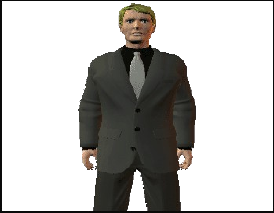
اللقطة المتوسطة البعيدة medium long shot